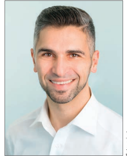
Prof. Dr. Jamal M. Stein (Aachen)

Während die Bedeutung der Mundhygiene für die Parodontitisätiologie kontrovers diskutiert werden kann, führt die antiinfektiöse Therapie im Sinne der Entfernung des subgingivalen Biofilms zu einer voraussetzenden Eliminierung/Reduktion der Infektion, die auch für eine gegebenenfalls folgende chirurgische Therapie eine wichtige Voraussetzung darstellt.