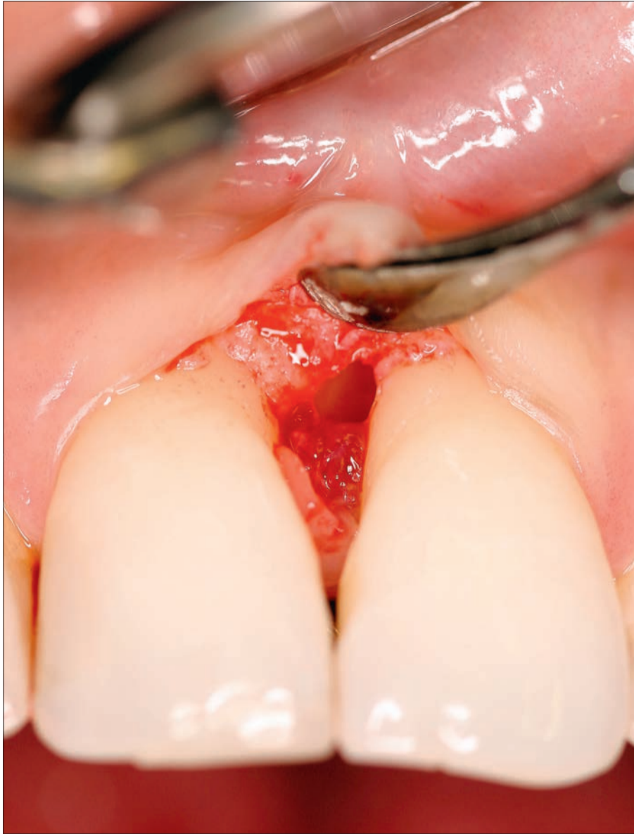
Abb. 3: Intraossärer Defekt