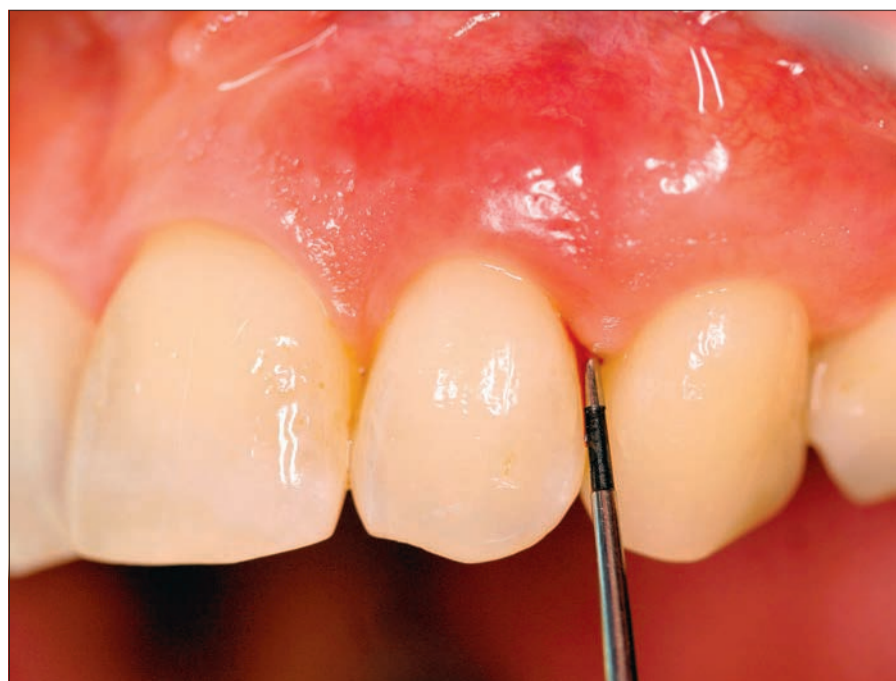
Abb. 2: Parodontale Tasche

Zum Thema „manuelle und maschinelle Wurzeloberflächenbearbeitung“ gab der Referent an, dass die maschinelle Reinigung einen Zeitvorteil im Vergleich zu manuellen habe, allerdings keinen Unterschied in der Effektivität zeige. Die Menge der abgetragenen Substanz sei abhängig von Zeit, Kraft, Winkel und Geräteeinstellung im Rahmen der Instrumentierung. Im Vergleich zum Ultraschall führt die Instrumentierung mit Küretten zu einer glatteren Wurzeloberfläche. Darüber hinaus berichtete Stein, dass die Kühlung mit einer Mischung aus Wasser und desinfizierender Mundspüllösung, etwa Chlorhexidin mit Wasser, keinen relevanten Vorteil im Vergleich zur alleinigen Wasserkühlung zeigt. Weiterhin betonte Stein